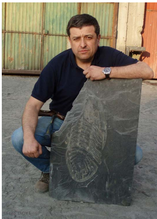
Гигантский экземпляр трилобита, Геопарк Arouca.