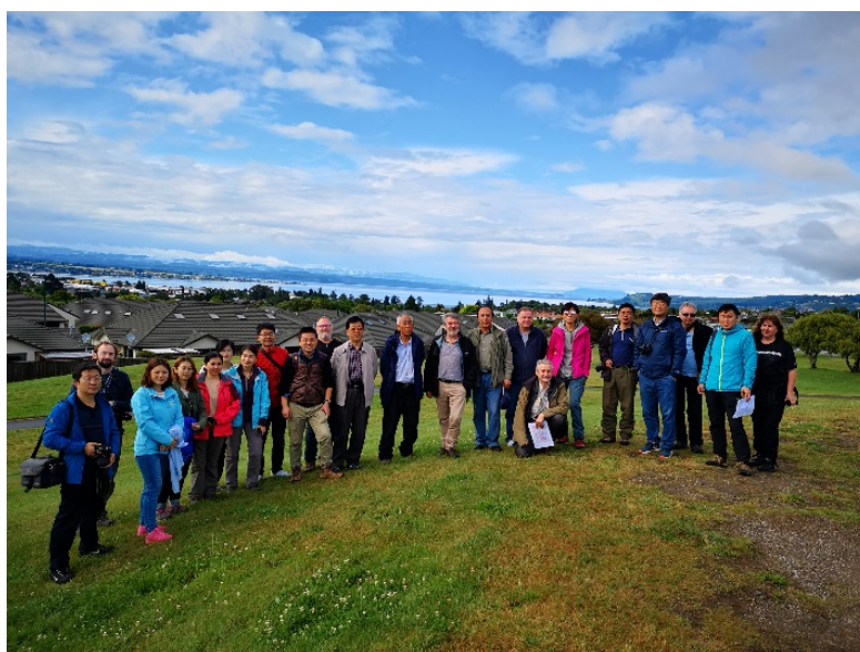
Общее фото группы геологов участников геологической экскурсии у озера Таупо и на окраине одноименного города, Новая Зеландия.