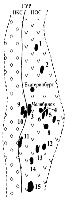
Рис. 1. Изотопный возраст (млн лет) тектонических блоков восточного склона Урала

1 – Салдинский – 1870; 2 – Мурзинско-Адуйский – 1650 ; 3 – Селянкинский – 2100; 4 – Кунашакский – 1525 (?); 5 – Ильиновский – 2080; 6 – Челябинский – 1930; 7 – Троицкий – 1760 (?); 8 – Кожубаевский – 1800–1900; 9 – Тараташский – 2000–2900; 10 – Александровский – 2000; 11 – Максютковский – 1520; 12 – Мариновский – 1600; 13 – Суундукский – 1050 (?); 14 – Адамовский – R_1 (?); 15 – Мугоджарский – 1200–2900