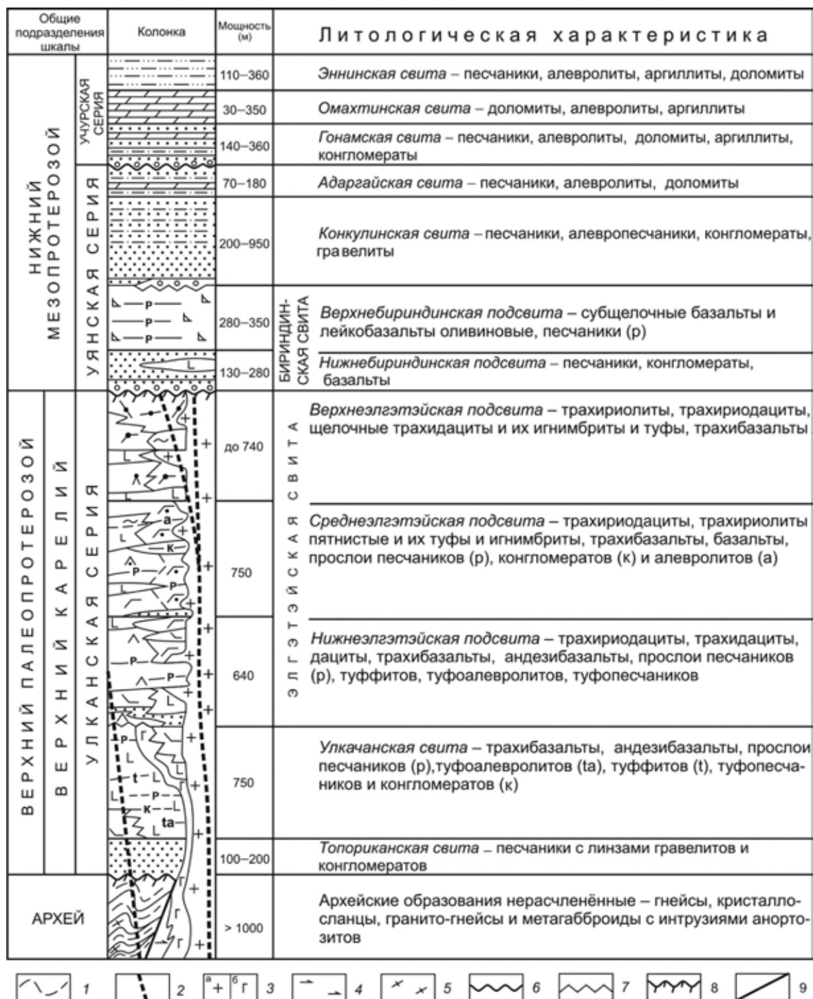
Рис. 2. Схема стратиграфии и магматизма Улкан-Учурского района

1 – архейские гнейсы и кристаллосланцы; 2, 3 – позднепалеопротерозойские интрузивные образования: 2 – базиты маймаканского, 3 – гранитоиды улканского (а) и габброиды гекунданского (б) комплексов; 4, 5 – архейские метагабброиды (4), граниты и гранито-гнейсы (5); 6, 7 – стратиграфическое (6) и угловое (7) несогласия; 8 – коры выветривания – литифицированные обломочные образования; 9 – разрывные нарушения